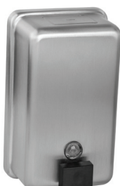
SLZN 39 95390 Nierdzewny podajnik mydła w płynie