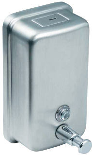
SLZN 05 95050 Nierdzewny podajnik mydła w płynie