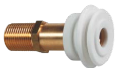
SLA 02 06020 Armatura spłukująca do podłączenia wody do pisuaru z dopływem od tyłu