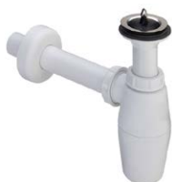
SLA 08 06080 Plastikowy syfon butelkowy 5/4" do zamontowania w SLP 17