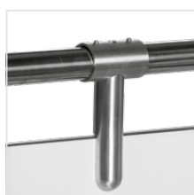
górnny profil rurowy, średnica 30 mm (stal nierdzewna); dla szerokości paneli do 60 cm nie ma potrzeby stosowania górnego profilu