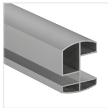
profil górny (aluminium anodowane)