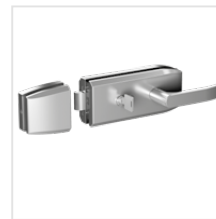
uchwyt z zamkiem cylindrycznym (stal nierdzewna)