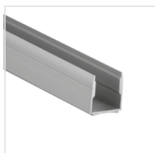
profil U do mocowania paneli do ściany (aluminium anodowane)