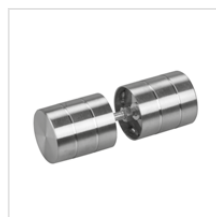
uchwyt drzwiowy do kabiny (stal nierdzewna)