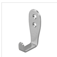
hak (stal nierdzewna)