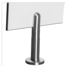
noga regulowana (stal nierdzewna)