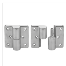
zawiasy samozamykające (stal nierdzewna)