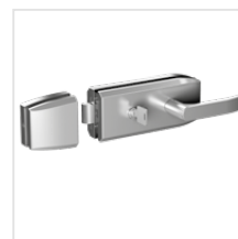
uchwyt z zamkiem cylindrycznym (stal nierdzewna)