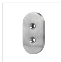
odbojnik drzwiowy (stal nierdzewna)