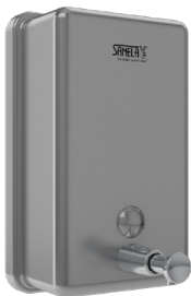
SLZN 39X 95392 Nierdzewny podajnik mydła w płynie