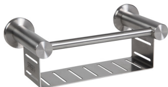
SLZN 76 85760 Nierdzewny uchwyt na szampon