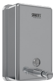
SLZN 39A 95391 Nierdzewny podajnik mydła w płynie