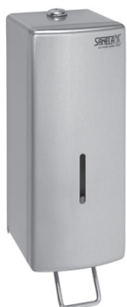
SLZN 73 85730 Nierdzewny naścienny podajnik mydła w płynie